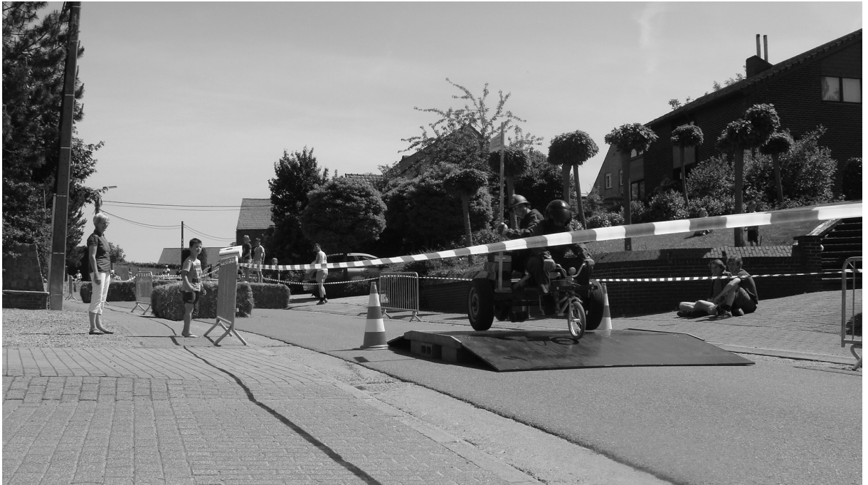
De KOD-zeepkist AC/DC bestuurd door Pieter en Jelle. Een snelle driewieler, een as van een aanhangwagen, een stuur van een kinderfiets, een rem en onderbouw van Oorbeekse esdoorn.