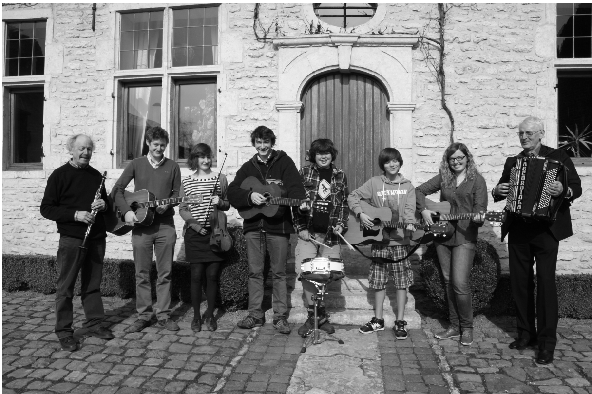
De nieuwe Oorbeekse formatie 't Juk.