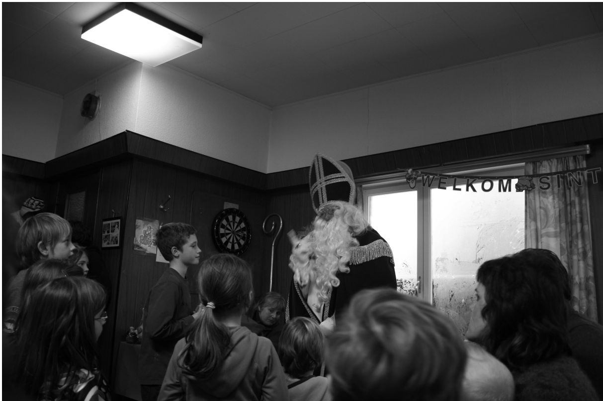
Heilige Norbert van het graafschap Gevers op pad.