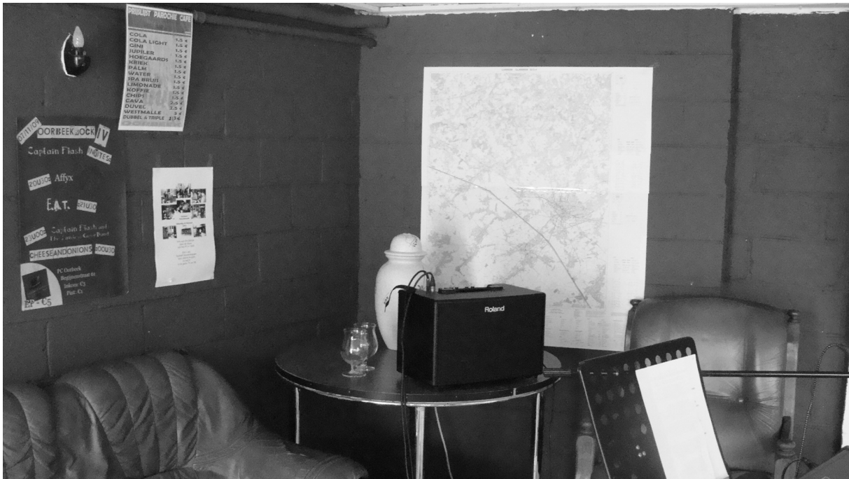
De kelder kreeg een flinke verbouwt.