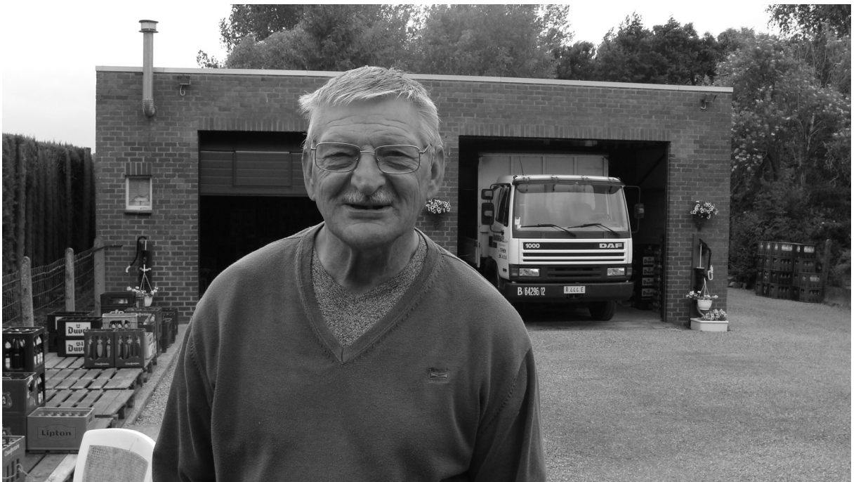
't Is genoeg geweest!