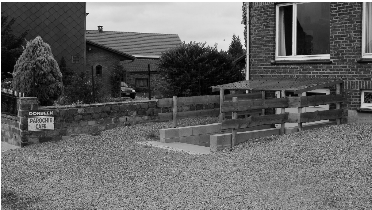
Een nieuwe nooduitgang.