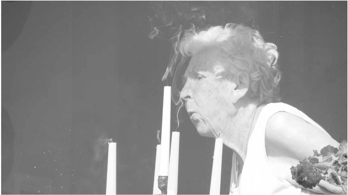
Oma blaast de processie 2011 uit.