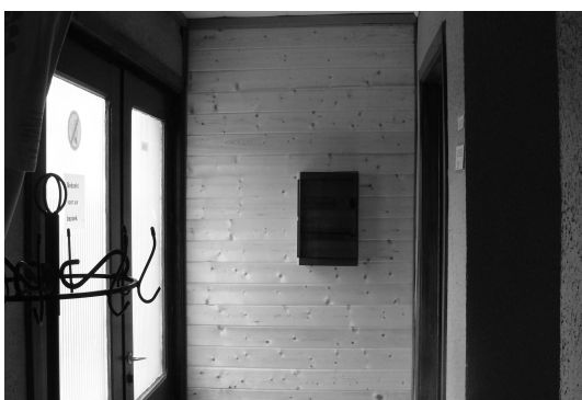
De electriciteitskast werd fraai ingekleed.